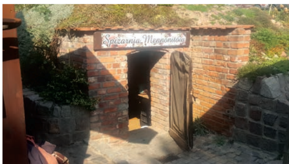
Nadwiślańska Chata - odtworzona spizarnia Mennonitów.