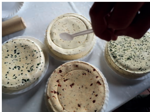
Sery wyprodukowane w trakcie warsztatów.