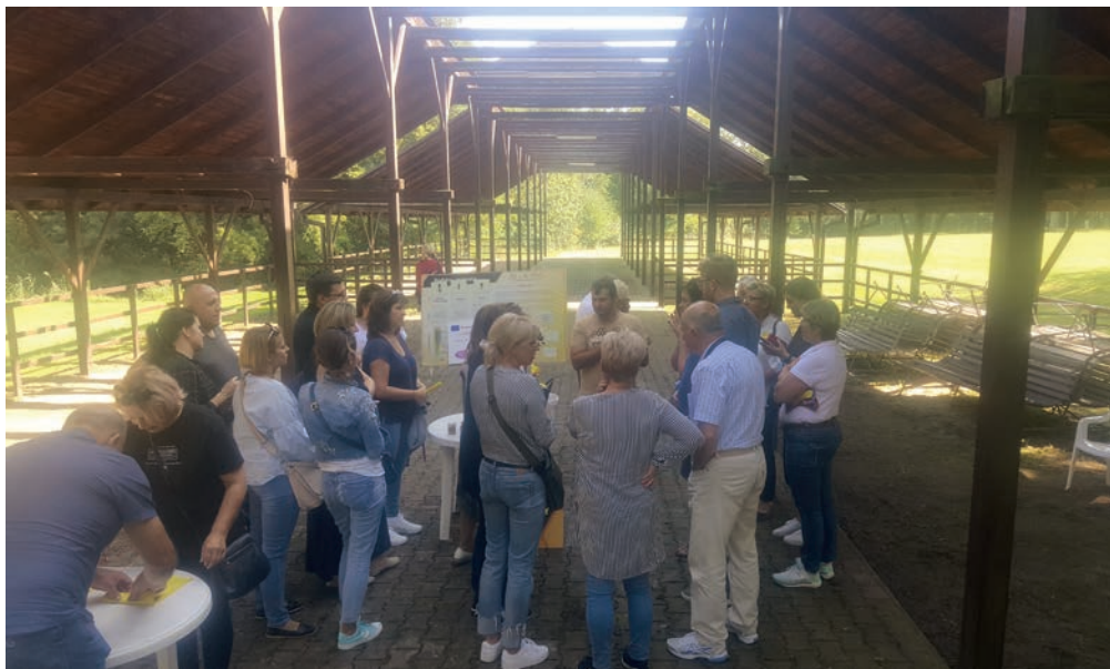
Wykład na temat pszczelarstwa.

„Europejski Fundusz Rolny na rzecz Rozwoju Obszarów Wiejskich: Europa inwestująca w obszary wiejskie” Instytucja Zarządzająca Programem Rozwoju Obszarów Wiejskich na lata 2014-2020 - Minister Rolnictwa i Rozwoju Wsi Publikacja opracowana przez Miasto i Gminę Pilawa Operacja współfinansowana ze środków Unii Europejskiej w ramach Schematu II Pomocy Technicznej „Krajowa Sieć Obszarów Wiejskich” Programu Rozwoju Obszarów Wiejskich na lata 2014-2020