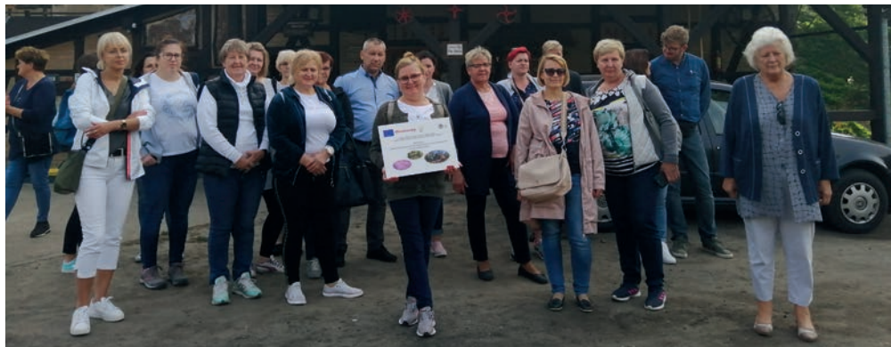
Pamiętkowe zdjęcie - Zabytkowy Młyn w Grucznie.

Wizyta miała na celu zapoznanie się z działalnością lokalnych serowarów zajmujących się m.in. produkcją serów z mleka krowiego oraz koziego – w trakcie wizyty uczestnicy zyskali możliwość zapoznania się z tajnikami wyrobu serów, jak również funkcjonowania gospodarstwa zajmującego się hodowlą rodzimych ras owiec. Były to praktyczne warsztaty, w trakcie których omawiane były wszystkie zagadnienia związane z tematem – od niezbędnych narzędzi poczynawszy, aż po fachowe wskazówki, od których uzależniony jest efekt końcowy w postaci pysznego sera.