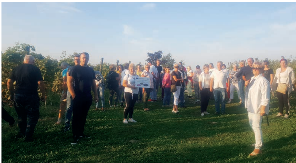
Winnica przy talerzyku - uczestnicy w trakcie wizyty studyjnej.