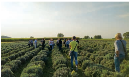
Lawendowe pole – wykład na temat uprawy.