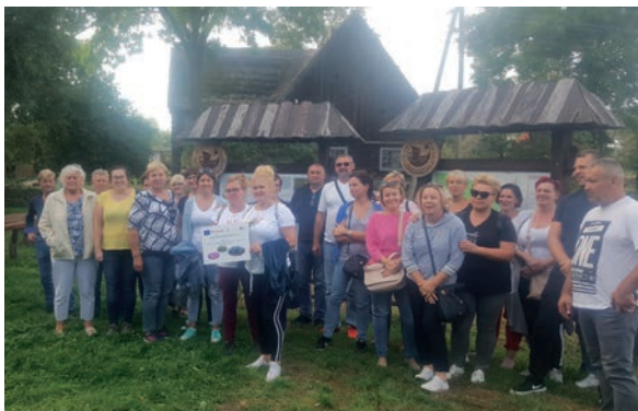
Zagroda Olęderska - pamiątkowe zdjęcie.

Poznali kolekcję 70 dawnych odmian jabłoni, suszarnię i przechowalnię owoców oraz budynki starej kuźni zaadoptowany na mieszkalny.