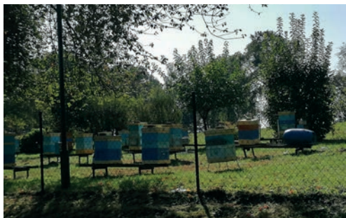
Widok pasieki CDR w Zarzeczewie.