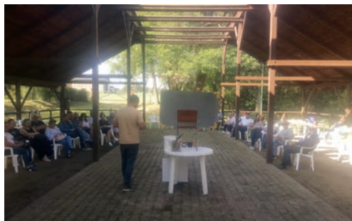
Wykładu o pasiece ciąg dalszy.