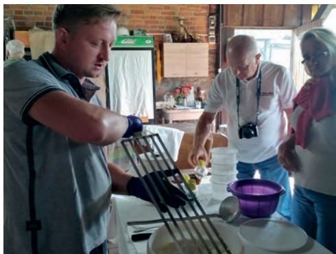
Gruczno - warsztaty serowarstwa.