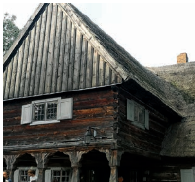
Zagroda Olęderska - zabytkowa chata.

Wizyta w zagrodzie Olęderskiej to niezapomniane przeżycie. Uczestnicy wyjazdu wysłuchali gawęd przewodnika o życiu Mennonitów – osadników olęderskich, niestrudzonych meliorantów Doliny Wisły, którzy potrafili okiełznać żywioł i żyć dzięki temu. W trakcie wizyty przewodnik oprowadzał po drewnianym podcieniowym domu krytym strzechą z 1791 r., budynku gospodarczym z drewnianymi pochylkami gdzie podczas powodzi wprowadzano inwentarz na piętro.