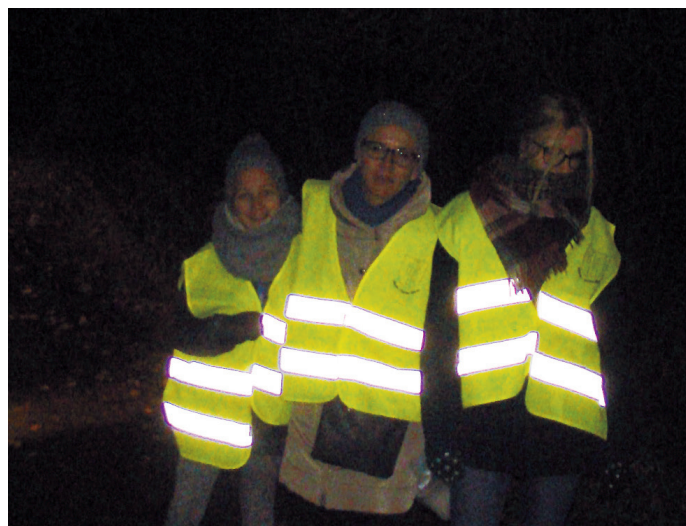
fot. Ubiegłoroczna akcja „Bądź widoczny na drodze – noś odblaski”.

O rozważę również prosimy pieszych, aby zwracali uwagę na to, co się dzieje na drodze, nie wchodzili na przejście dla pieszych bezpośrednio przed nadjeżdżający pojazd, gdyż droga hamowania samochodu wynosi kilkadziesiąt metrów. Apelujemy o to by nosić odblaski. Każdy z nas powinien nosić elementy odblaskowe by świecić przykładem dla innych.