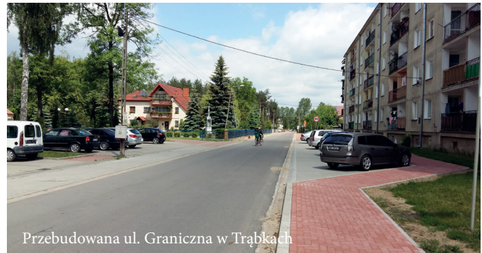
Przebudowana ul. Graniczna w Trąbkach

Kierowcom i mieszkańcom dziękujemy za wyrozumiałość i cierpliwość przy utrudnieniach, które powstały na skutek realizowanych inwestycji.