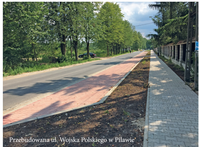
Przebudowana ul. Wojska Polskiego w Pilawie'