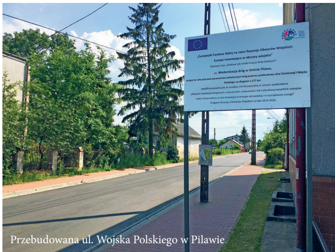
Przebudowana ul. Wojska Polskiego w Pilawie