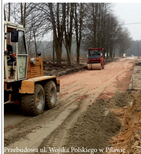
Przebudowa ul. Wojska Polskiego w Pilawie