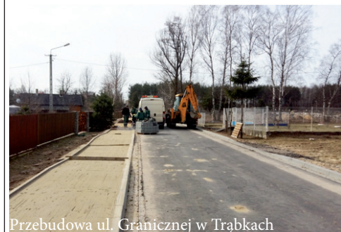
Przebudowa ul. Granicznej w Trąbkach

W ramach inwestycji realizowana jest przebudowa ul. Wojska Polskiego w Pilawie oraz przebudowa ul. Granicznej w Trąbkach. Planowany termin zakończenia inwestycji - maj 2017 rok.